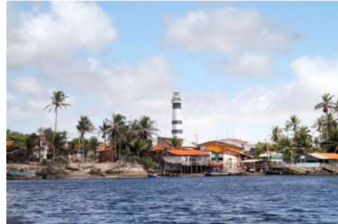
マンダカルの灯台